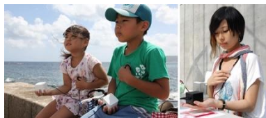
“ドキドキ”心臓ピクニック